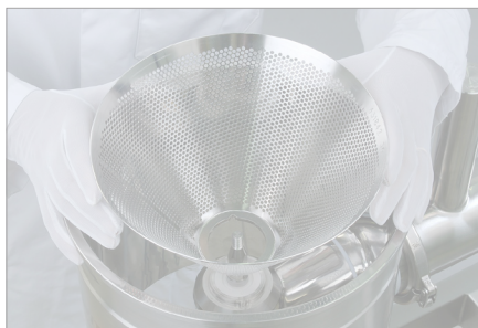
Option broyeur à tamis