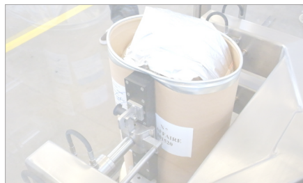
Option écraseur de fûts

Le concasseur va écraser le produit aggloméré tandis que le système de broyeur secondaire va fragmenter le produit en poudre pouvant, par exemple, poursuivre son traitement dans un broyeur à tamis.