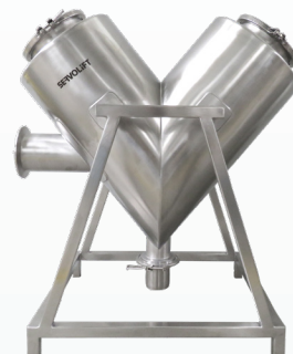
Conteneurs en forme de V