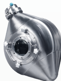
Forme double cône