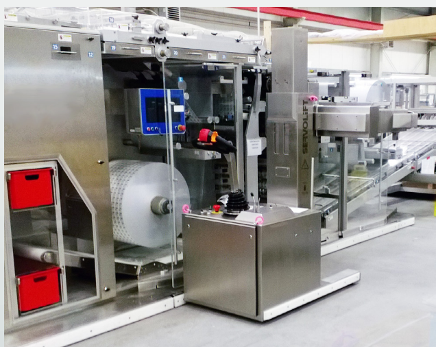
Positionnement latéral pour le remplacement d'un rouleau sur une ligne blister