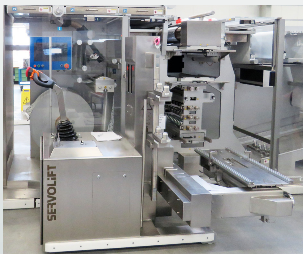
Remplacement d'un module sur une ligne blister

Poids de la machine : 1200kg Hauteur maximale : env. 1800mm Charge maximale : 400kg Portée latérale maximale : 1200mm